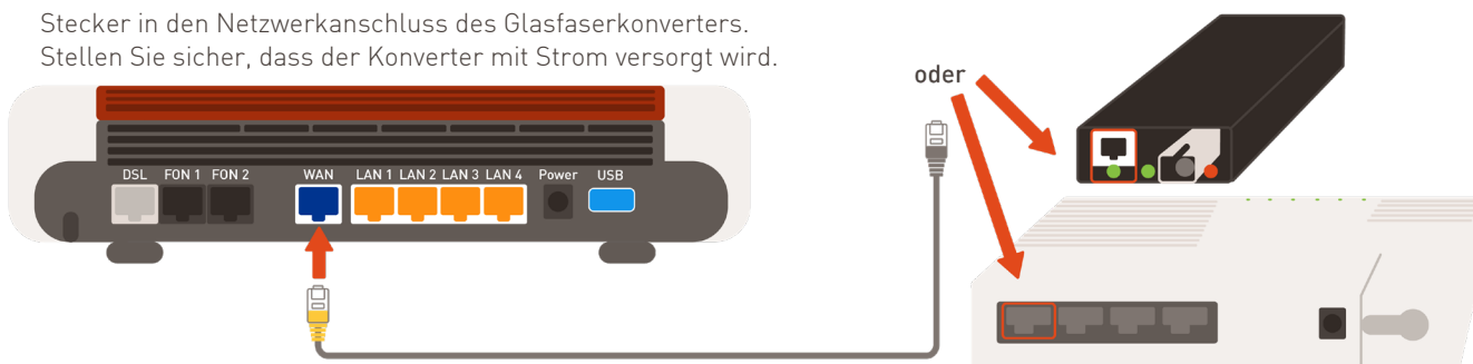
Anschließen des Glasfaser-Konverters