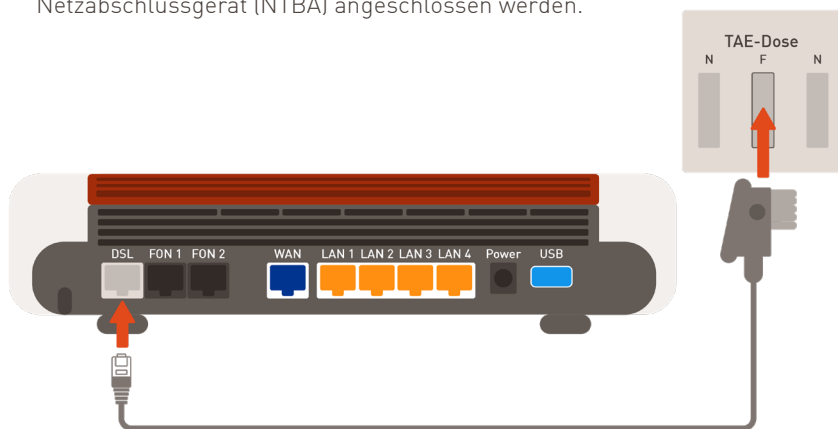
Verbindung mit dem DSL-Anschluss herstellen